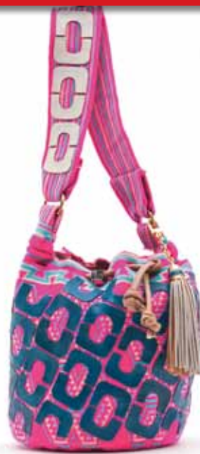
Diane von Furstenberg