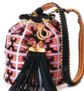
Jorge Duque (Colombiano ganador de Project Runway Latinoamérica)